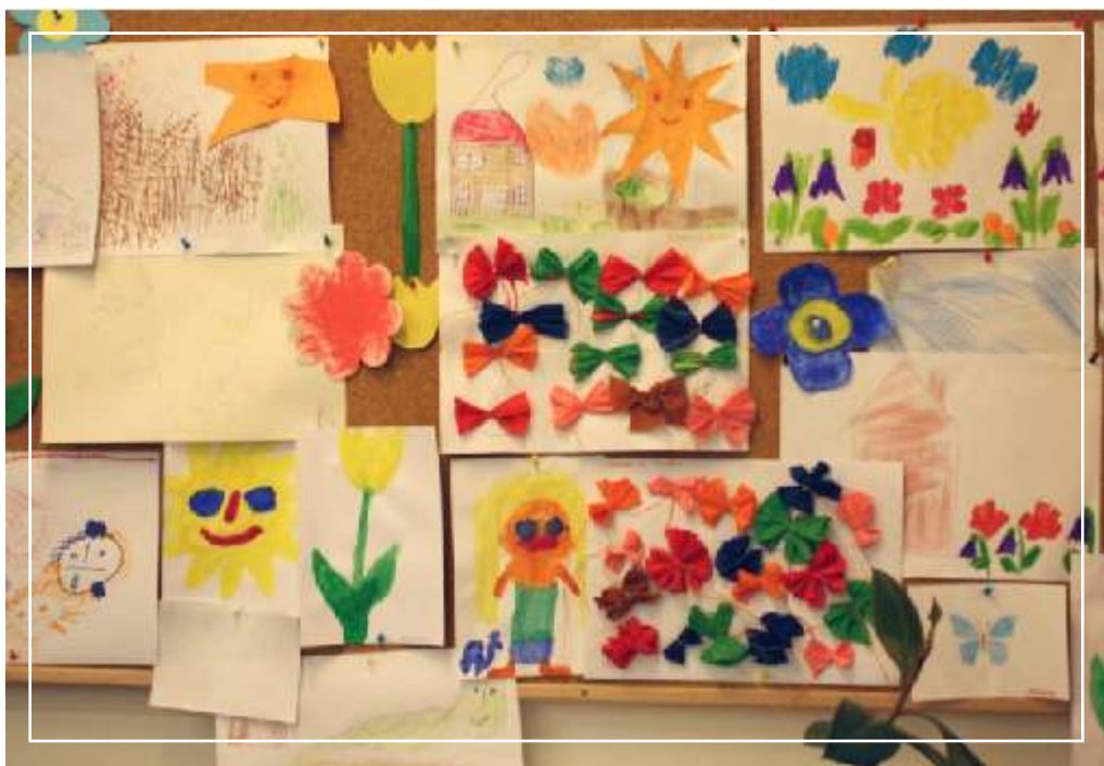
Tvorba našich klient