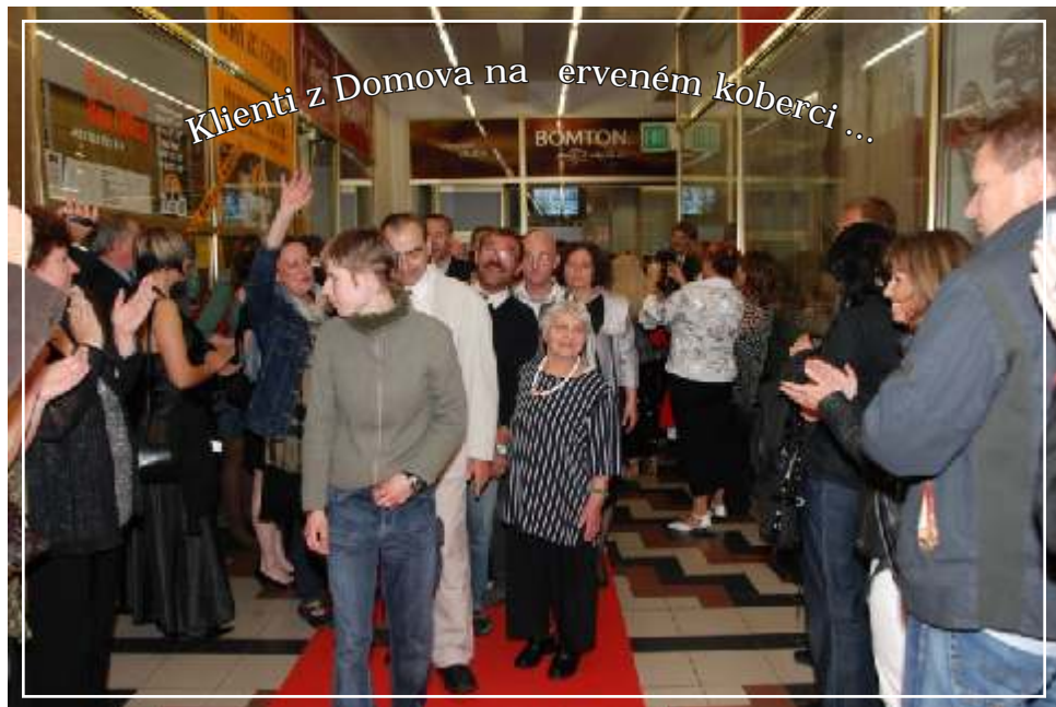
Klienti z Domova na červeném koberci ...