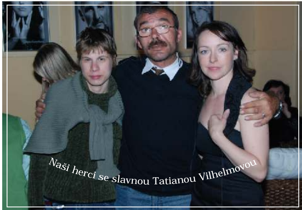
Naši herci se slavnou Tatianou Vilhelmovou